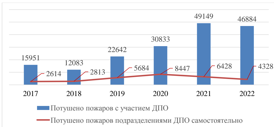
Рисунок 1. Участие подразделений ДПО в тушении пожаров на территории Российской Федерации в 2017-2022 годах

Наибольшее количество случаев привлечения подразделений ДПО к тушению пожаров в 2022 году зафиксировано на территории Новосибирской области (5 768), Московской области (3 409), Ростовской области (2 686), Алтайского края (2 151), Республики Башкортостан (1 788) и Краснодарского края (1 773).